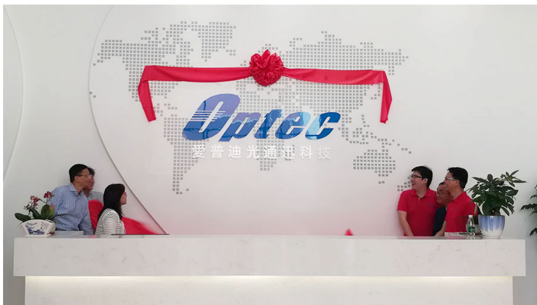
(爱普迪东莞新厂揭牌仪式)

连接组件以及设备内部用到的超多芯高密度光学连接方案（Shuffle）等提供完整的制造能力。